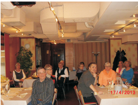
Elinsiirron saaneiden illanvietossa kuunneltiin keskittyneesti aurinkotietoutta

Ihoa voi suojata auringonpaisteelta myös pukeutumalla pitkähihaisiin ja pitkälahkeisiin vaatteisiin. Nykyään on